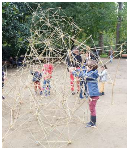
Construction collective en bambou

Le samedi 17 octobre en continu entre 14h et 18h / gratuit sans réservation goûter offert à 16h / Tout public, enfants à partir de 5 ans