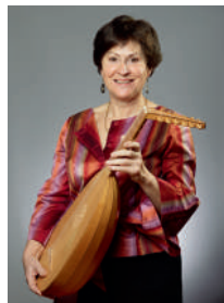
J-M Guilbert © J-J Bernier