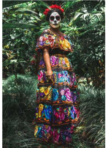
Au Mexique, lors de la célèbre fête des morts, Dia de los muertos, la tradition veut que les participants se maquillent en squelette

Les Samedis du Passage ouvrent la réflexion et les échanges autour de trois axes sur trois demi-journées qui sont l'occasion d'entendre des spécialistes venus d'horizons divers et de débattre avec eux.