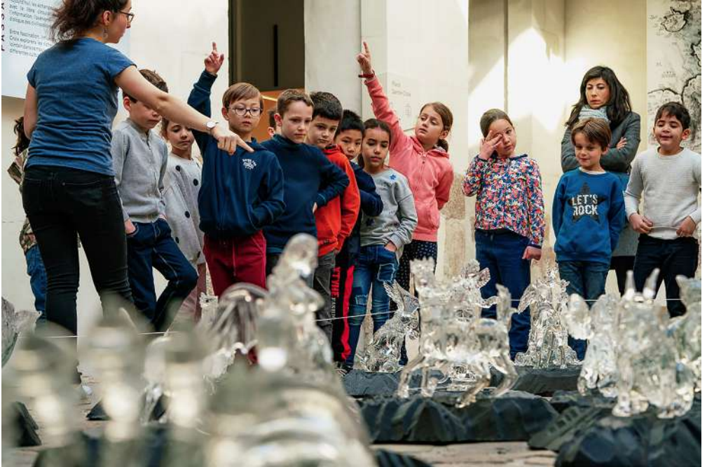
Visite scolaire de l'exposition Ici, un dragon de Qiu Zhijie (janvier > avril 2019)

À chaque exposition, des visites spécifiques sont conçues pour les groupes scolaires. Pour plus d'informations, contactez : scolaires.passage@gmail.com