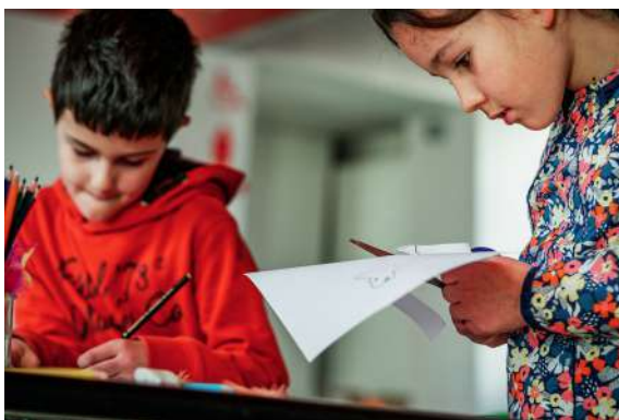
Atelier Dragons somptueux et cochons terreux, fév. 2019