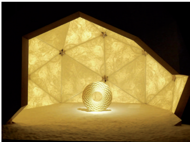
Haute Sphère , 2010, Sylvain Dubuisson © Bernardaud

À l'occasion de Noël, le Passage Sainte-Croix présente dans son patio, Haute Sphère , une crèche monumentale en porcelaine imaginée par le designer Sylvain Dubuisson et réalisée par la manufacture Bernardaud. Créée en 2010 pour l'église de la Madeleine à Paris, elle symbolise la pureté et la beauté céleste de la naissance du Christ à travers des matériaux nobles comme la porcelaine et le bois et donne à voir une représentation abstraite de la sainte famille. Une œuvre tout en finesse et poésie.