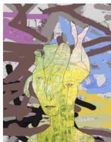
Idiot de Nantes © Pierre Rosin