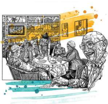
Illustration © MAHNU

Samedi 21 novembre de 14h30 à 17h30 / Entrée libre