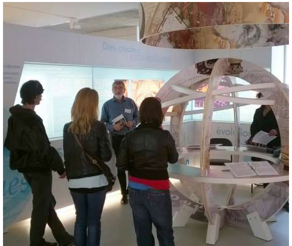
Visite-débat de Questions d'Homme : Quel monde à venir ?

Et retrouvez chaque samedi, entre 14h30 et 17h30, un médiateur pour vous accompagner dans votre visite.