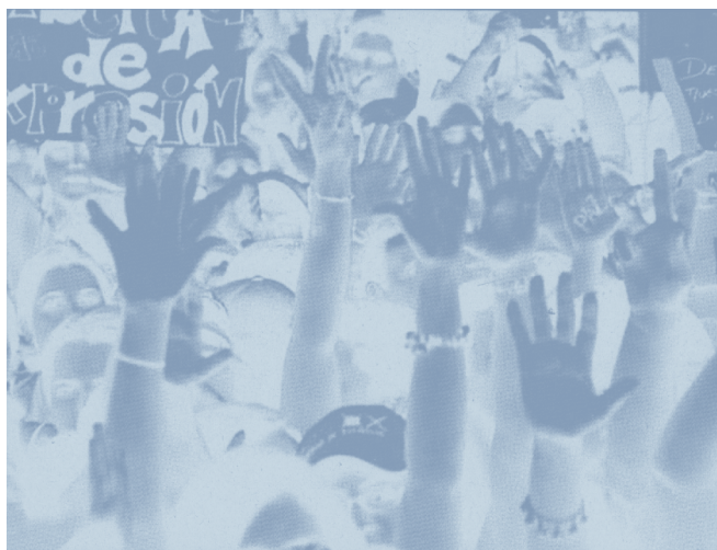
Je suppose que oui , 2020, Christophe Viart

Christophe Viart questionne les rapports que chaque individu entretient avec son image, son visage, son profil à l'ère des réseaux sociaux, de la vidéosurveillance, de la reconnaissance faciale dans notre société d'exposition. Il s'interroge sur la pertinence d'ajouter de nouvelles images dans un monde qui en est déjà saturé, tout en invitant les visiteurs à devenir les cocréateurs d'une œuvre à faire à plusieurs. Il s'agit de se demander comment être soi-même.