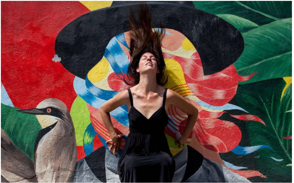
Peinture de Cyndie Belhumeur, modèle LEM © Alizée Gau

Samedi 3 octobre à 15h30 / Participation libre