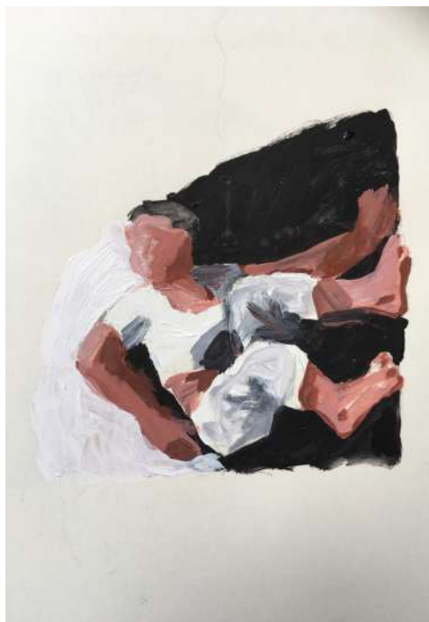
Peinture de Vonnick Caroff © Vonnick Caroff

*Lors des café-philos-théos, des intervenants exposent une thèse (qui n'engage qu'eux-mêmes) ; ils la soumettent à la discussion des participants et un médiateur du Passage Sainte-Croix permet l'expression des autres aspects de la question.