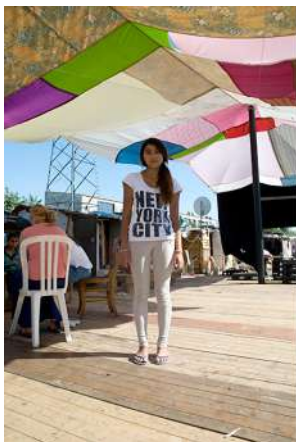
Violeta, 2014