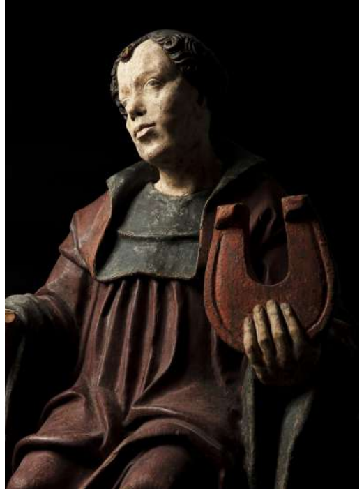
Saint Éloi, bois peint, vers 1510-1520, Allemagne du sud (Bavière), Musée Dobrée, inv. 953.1.1

Exposition présentée en partenariat avec le musée Dobrée - Grand patrimoine de Loire-Atlantique