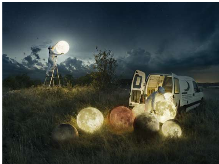
Full Moon Service, 2017 © Erik Johansson

Du samedi 14 septembre au samedi 16 novembre / Entrée libre