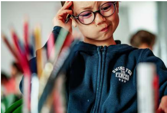
Atelier au Passage Sainte-Croix, hiver 2019

À travers la découverte de précieux objets des collections médiévales du musée Dobrée, les petits visiteurs jouent aux détectives et créent en atelier « leur propre saint » qu'ils emporteront chez eux.