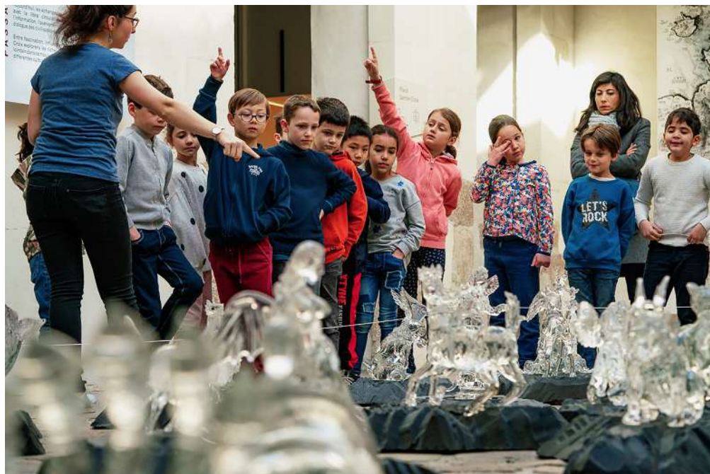
Visite scolaire de l'exposition Ici, un dragon de Qiu Zhijie (janvier > avril 2019)

À chaque exposition, des visites spécifiques sont conçues pour les groupes scolaires. Pour plus d'informations, contactez : scolaires.passage@gmail.com