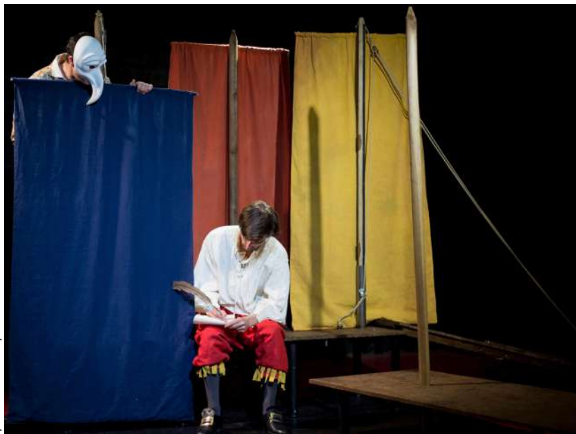
Spectaculum Incipit

Vendredi 27 et samedi 28 septembre à 20h30 / Tarif : 12€ (Réduit : 8€) / Durée : 1h10 Réservation à theatredes3singes@gmail.com ou au 06 32 19 87 80