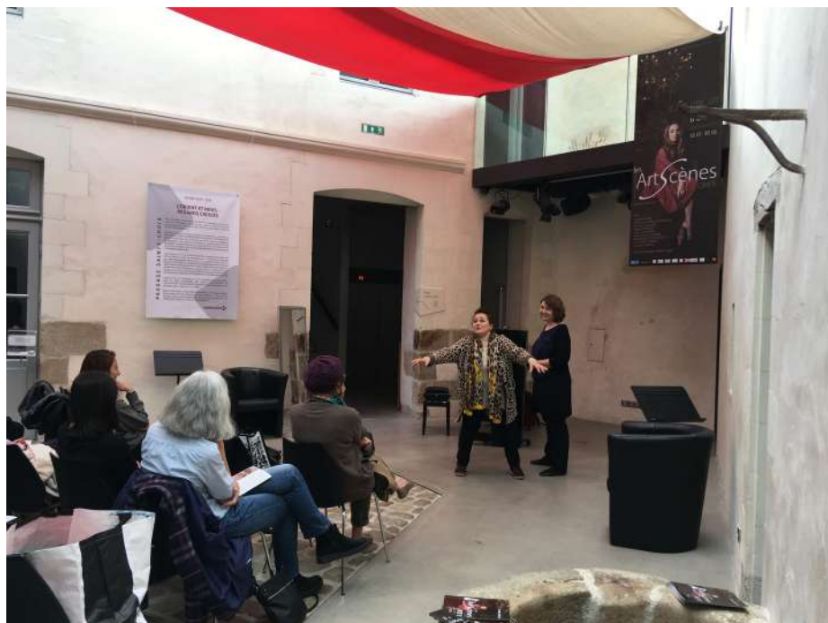
Les Art'Scènes au Passage Sainte-Croix avec la cantatrice Leontina Vaduva, mai 2019

MASTER CLASSES PUBLIQUES DE CHANT LYRIQUE