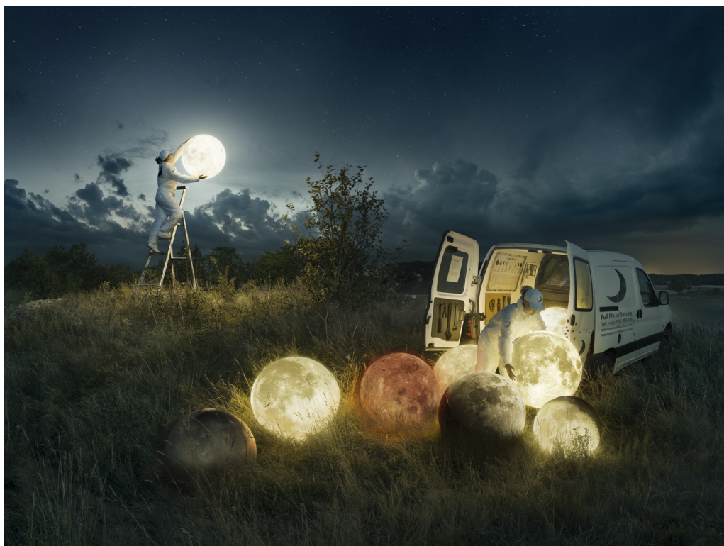
Full moon service , 2017

Exposition présentée au Passage Sainte-Croix dans le cadre de la Quinzaine Photographique Nantaise du 14 septembre au 16 novembre 2019