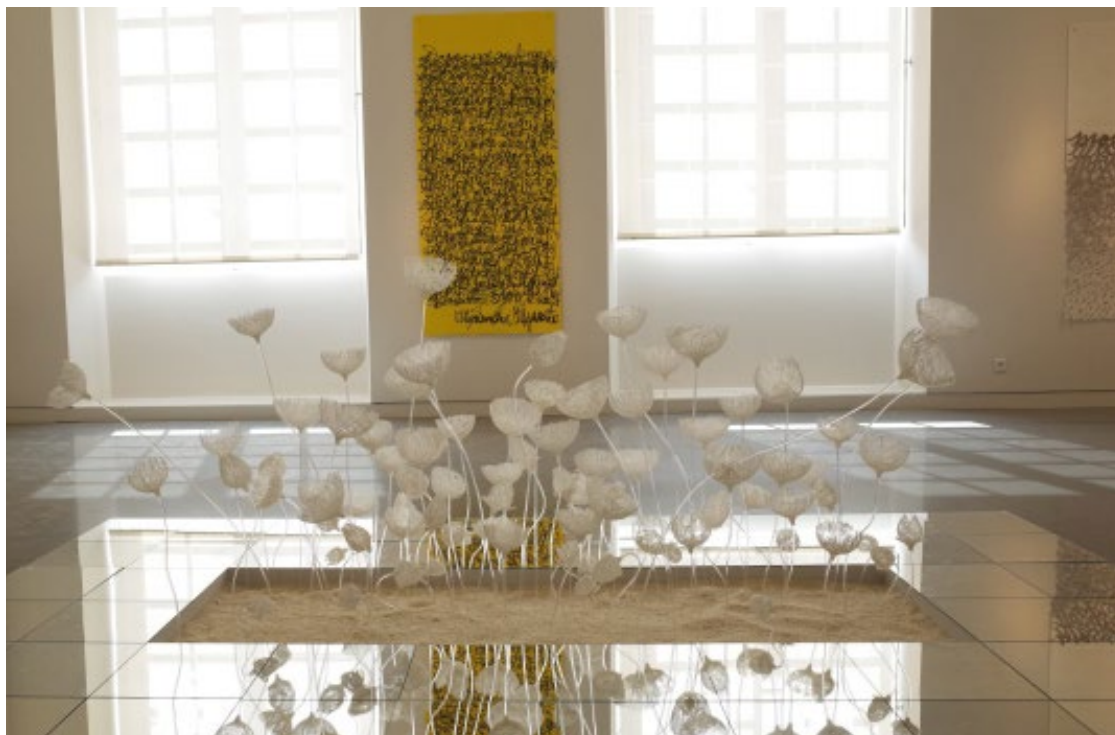
Exposition au Musée de Valence (2018)