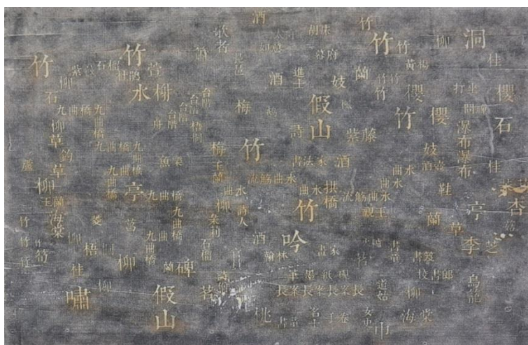
L'un des « Sept jardins », encre sur papier, texte imprimé, plaques en plexiglas, 40x60cm, 2014