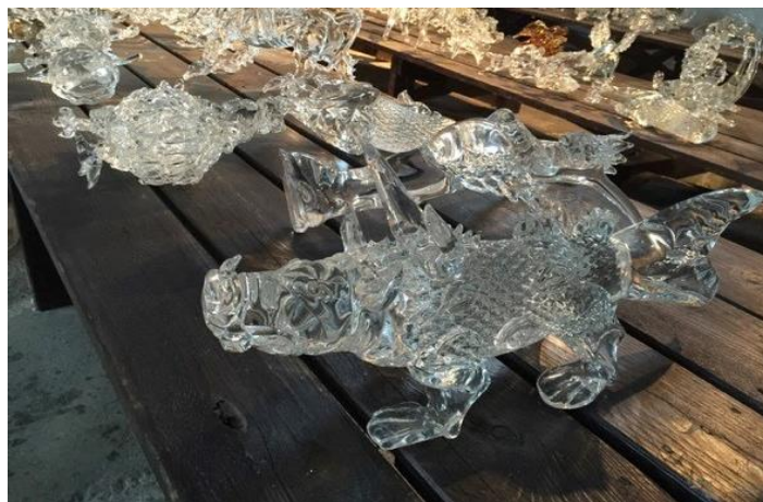
Préparation de Davantage de créatures sont en route,

« Chaque culture croit que ses propres monstres sont uniques et aspire à les faire connaître aux autres peuples. En réalité, il y a la logique sous-jacente. [...] Je l'ai explorée profondément. » Qiu Zhijie