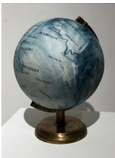
Géographie des idées, globe, 30cm, 2018

Chaque homme est un explorateur qui s'ignore : il ne cesse de découvrir des terres inconnues autour de lui, ou en lui-même.