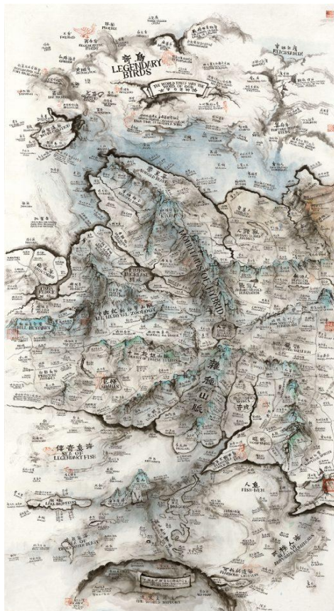
Géographie des animaux mythologiques, encre sur papier de riz, 240x120cm, 2017

Pour plus d'information, n'hésitez pas à envoyer un courriel ou à téléphoner.