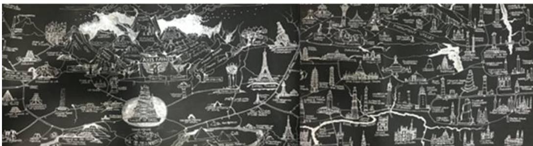
Carte de Tallinn , marqueur sur carton noir, 400x40cm, 2018

Aujourd'hui, les échanges se sont multipliés et complexifiés avec la mondialisation, l'instantanéité de l'information. Entre fascination, influences et échanges, le Passage Sainte-Croix explore les richesses de cette relation à l'autre et au lointain.