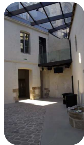
Pâtio du Passage Sainte-Croix – Nantes

Le Passage Sainte-Croix est un centre culturel initié par le diocèse de Nantes et géré par une association culturelle. Il accueille des conférences, des stages, des expositions, du spectacle vivant et des concerts dans le cadre d'une saison culturelle annuelle.