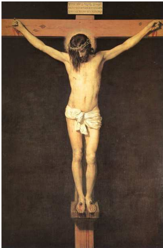
Diego Velázquez, Le Christ sur la Croix , Huile sur toile, 250 X 170 cm, Musée du Prado, Madrid, vers 1632.

L'exposition FIAT LUX présente une interprétation artistique contemporaine de l'histoire de la Passion du Christ.