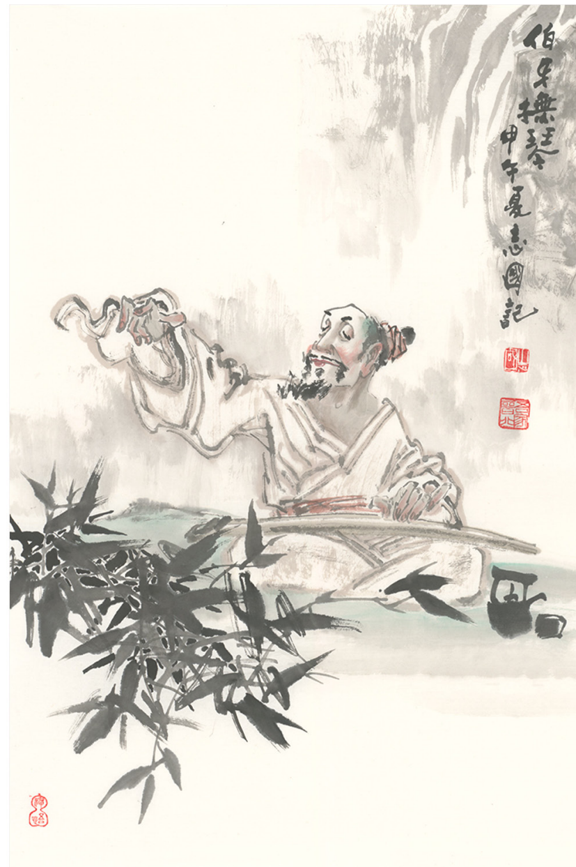
Boyafuqin © HAO ZHIGUO

Professeur à l'université d'art de Datong et Lauréat du prix Luxun pour la gravure, il est aussi Membre de l'association des artistes chinois, Directeur de l'association des artistes graveurs de Chine, Membre de la Fondation du Shandong pour le développement culturel, Directeur de l'Académie de calligraphie internationale de Chine, Président de l'académie de peinture Taishan et Président d'honneur de l'académie des beaux-arts de Yungang.